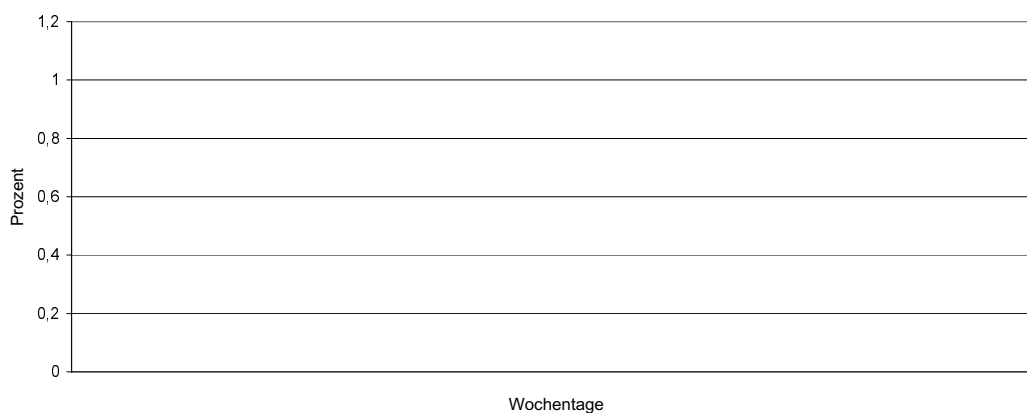
Eingriffe pro Wochentag (Diagramm 3)