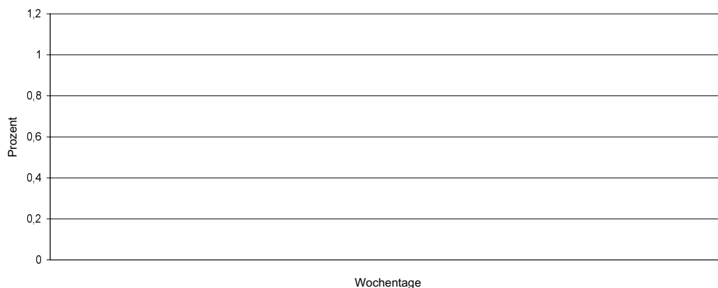
Aufnahmen pro Wochentag (Diagramm 2)