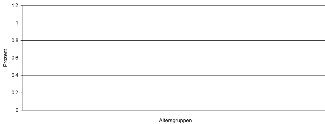
Altersverteilung (in Jahren) (Diagramm 4)